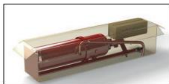
Voorgemonteerd. Een doos.